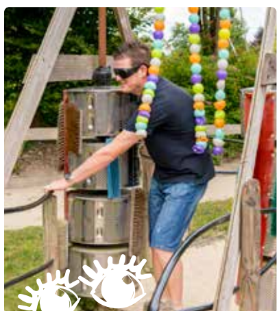
Active tes sens: Cap' de marcher sans la vue ?